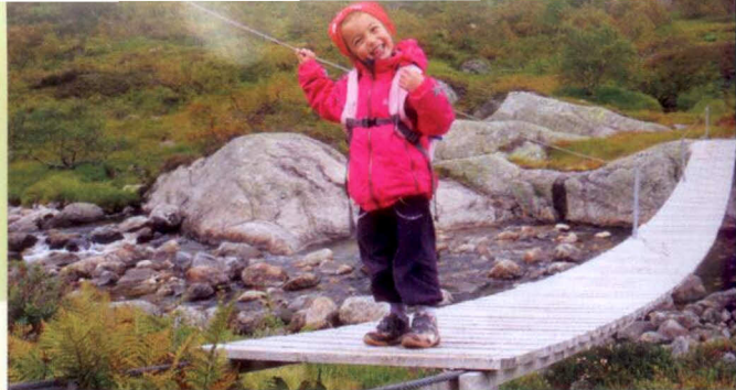
Alle hyttene er plassert slik at en på fire år kan gå fram selv

SCAN KODEN FOR Å LESE MER OM JUBILEUMSPROSJEKTENE